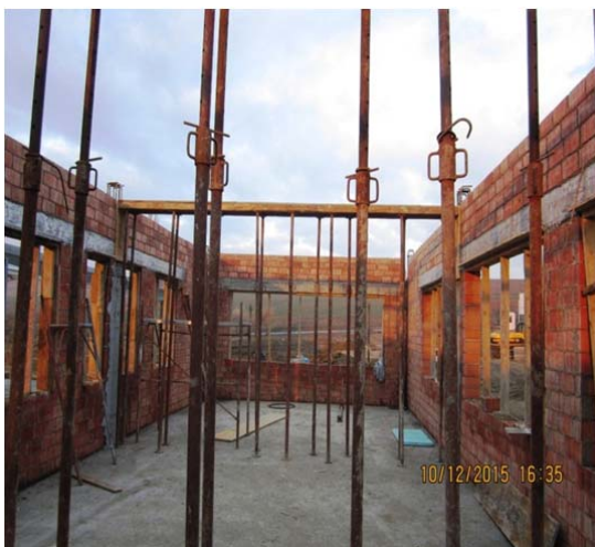
Cladire Administrativa - lucrari suprastructura