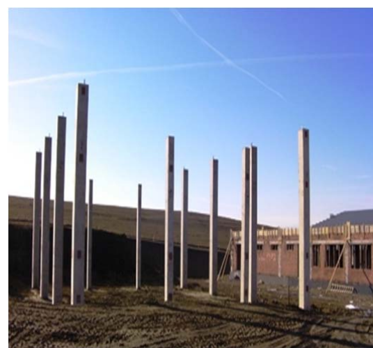
Montaj stalpi prefabricati in fundatii izolate