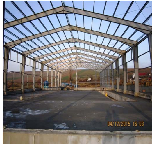
Hala Sortare - turnare pardoseala