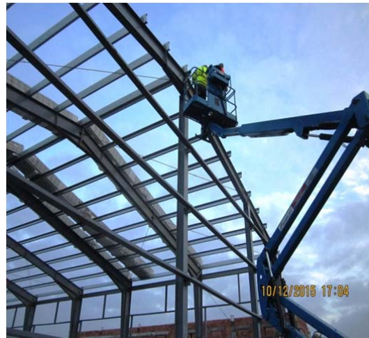
Hala Sortare - verificare imbinari grinda -stalp cu suruburi SIRP