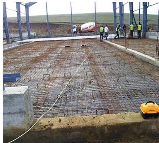
Hala Sortare - armare pardoseala