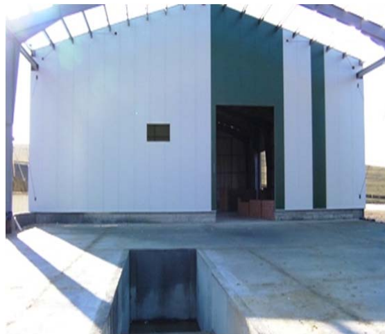
Hala Sortare - montare panouri pereti fronton ax 7/A-E