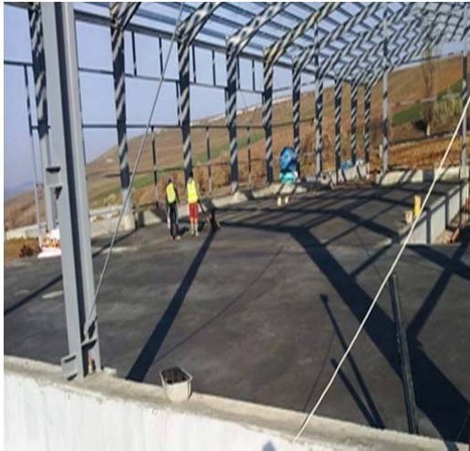
Hala Sortare - elicopterizarea betonului