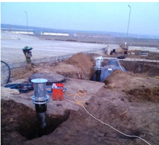
Montaj teava ventilatie naturala Statie pompare hidrofor