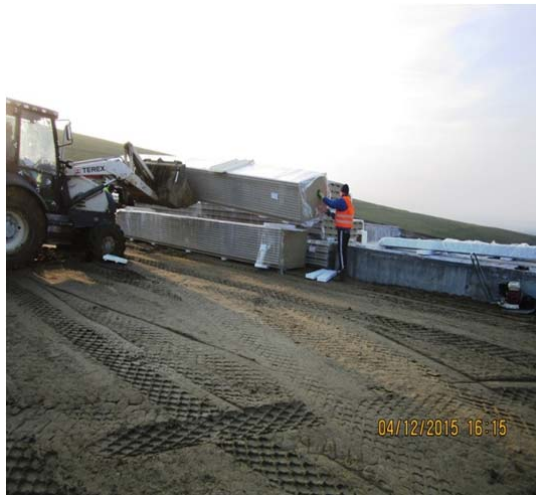
Hala Sortare - receptie panouri acoperis si pereti