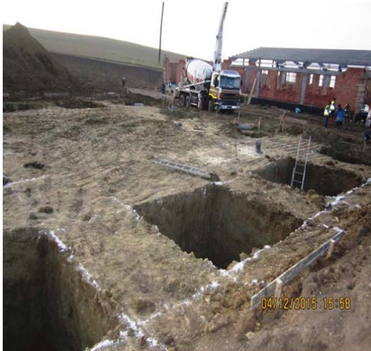
Cladire Interventii Utilaje - fundatii izolate