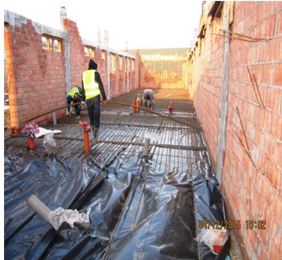
Cladire Administrativa - armare pardoseala