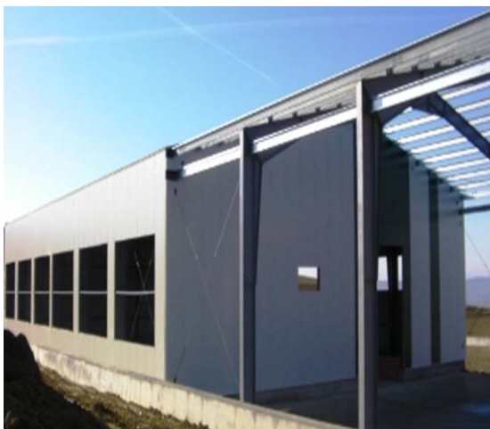
Hala Sortare - montare panouri pereti si acoperis