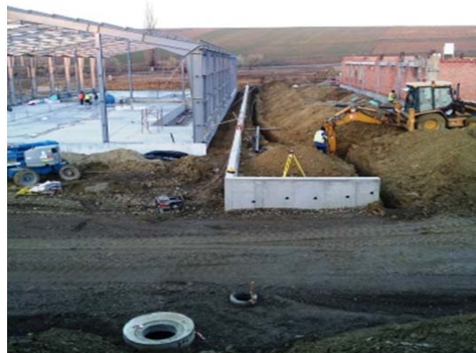
Sapatura sant retea hidranti exteriori