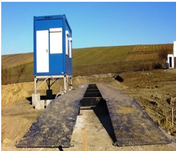
Cantar Rutier si Container - montare echipament