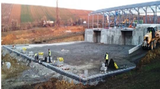
Platforma rutiera incinta - lucrari de sistematizare