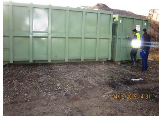
Receptie prescontainer 24mc